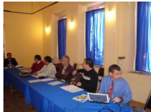
Asamblea de Guadalajara, Jalisco

Durante los días 25 y 26 de noviembre de 2005 en el estado de Jalisco la FECIME desarrolló diversos trabajos. El viernes 25 en el local del CIMEJ, se procedió con la Reunión de trabajo relacionada con UVIES, en la cual se contó con la valiosa participación de representantes de diversos colegios, destacó el interés en el estatus que guarda la NOM-001-SEDE así como los nuevos PEC de las NOM-007 y NOM-013 y su próxima publicación.