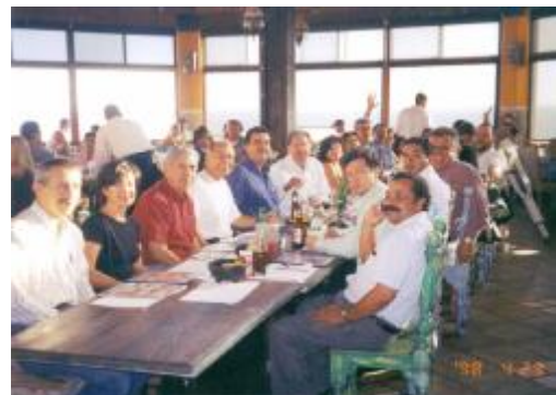
Una sana convivencia durante los eventos en Tijuana, B.C.